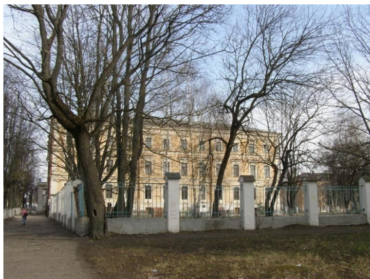
Псков. Школа №1 (Псковская мужская гимназия). Историческая справка . Фот. 2007 г.