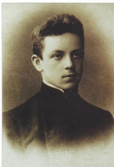
Юрий Тынянов – выпускник гимназии. 1912 г.