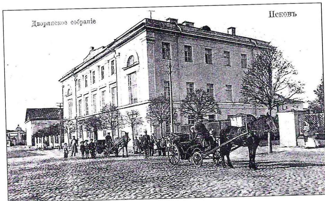
Дом Дворянского собрания.